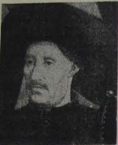
O Infante D. Henrique

O oceano, uma promessa para os grandes heróis. A lenda de marinagem, incipiente!