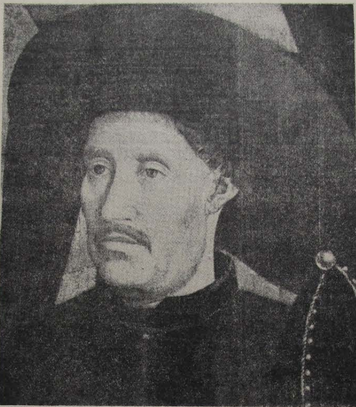
O Infante D. Henrique

D. Henrique, lídimo representante do gênio aventureiro do seu po-