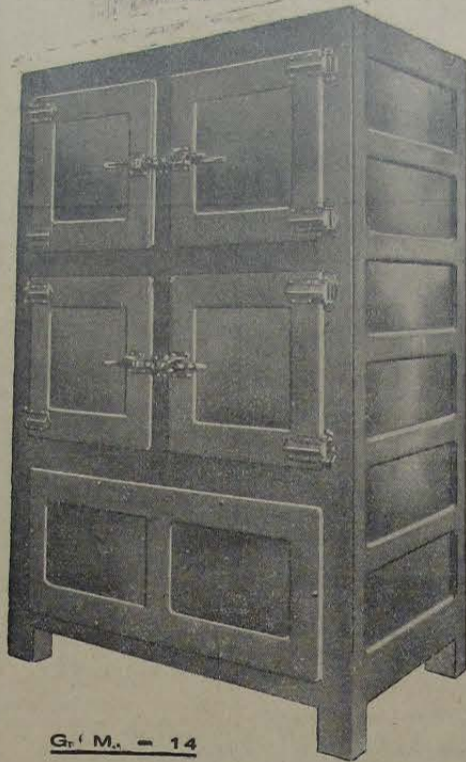
G. M. - 14