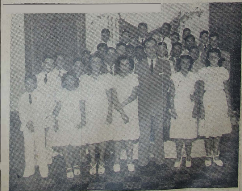
EM IMPONENTE SOLENDIDADE, realizada no dia 17 do corrente, o CURSO IGUAÇÚ entregou os diplomas a mais uma turma do curso primário.