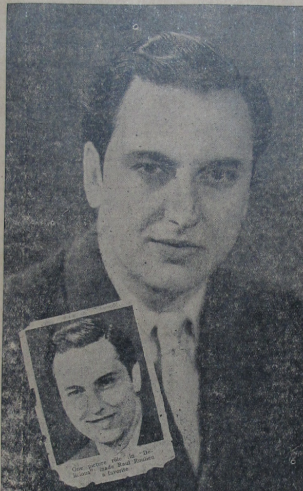
One picture más da "Delicious" made Raul Roulien a favorite

O Rio de Janeiro acolheu, hontem, o grande embaixador do Brasil em Hollywood e nosso illustre patricio RAUL ROULIEN, que tanto soube, em terra estranha, elevar o nome de nossa Patria. A figura moça e sympathica do notavel artista brasileiro impoz-se difinitivamente num meio onde innumerables filhos do paiz não lograram vencer, o que prova o valor do novo astro da cinematographia norte-americana e dentre em pouco destinado a figurar na galeria dos astros de renome mundial.